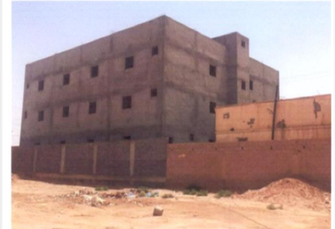
وقف أهل القرآن بالعويقيلة