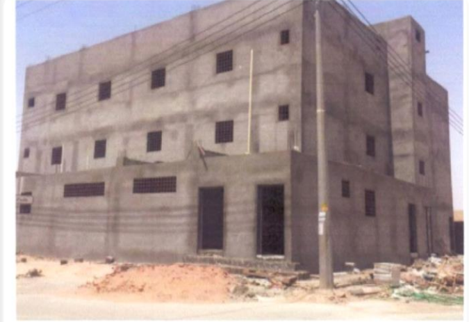
وقف أهل القرآن بالعويقيلة