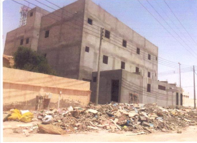
وقف أهل القرآن بالعويقيلة