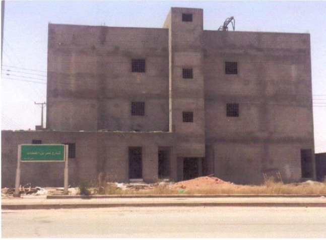
وقف أهل القرآن بالعويقيلة