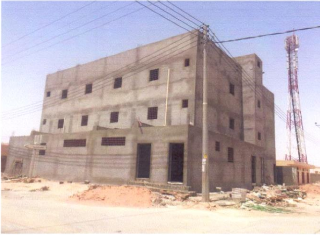
وقف أهل القرآن بالعويقيلة