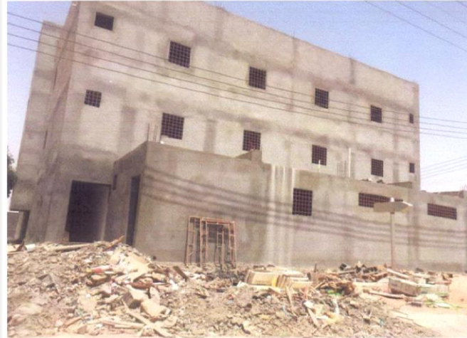
وقف أهل القرآن بالعويقيلة